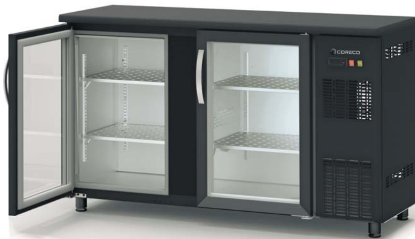
SBE-150 estantes chapa inox opcional optional SS panel shelves