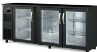
SBE-200 motor izquierda left side engine